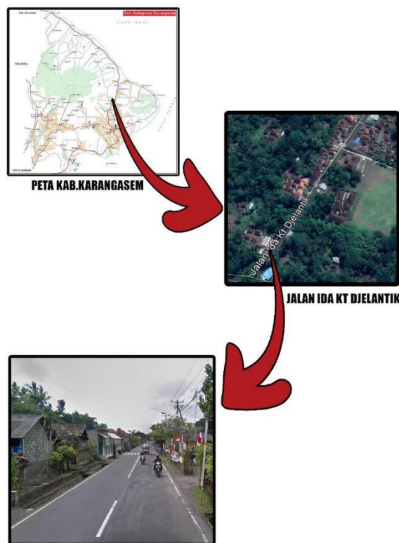
Gambar 1. Lokasi pengambilan material recycle perkerasan Aspal Pavement (RAP)

Penelitian ini dilakukan dengan metode eksperimen dengan cara melakukan percobaan laboratorium untuk memperoleh data yang diinginkan. Tujuan utama dari penelitian ini adalah mengetahui nilai kuat tekan bebas Unconfined Compressive Strength (UCS) dari campuran Cemen Treated Recycling Base (CTRB). Pelaksanaan pembuatan benda uji dalam penelitian ini dilakukan di laboratorium material Teknik Sipil Universitas Pendidikan Nasional (Undiknas Denpasar), pengujian material dilakukan di laboratorium material Teknik Sipil Universitas Udayana, dan pengujian kuat tekan bebas Unconfined Compressive Strength Test (UCS) dilakukan di laboratorium material Teknik Sipil Politeknik Negeri Bali.