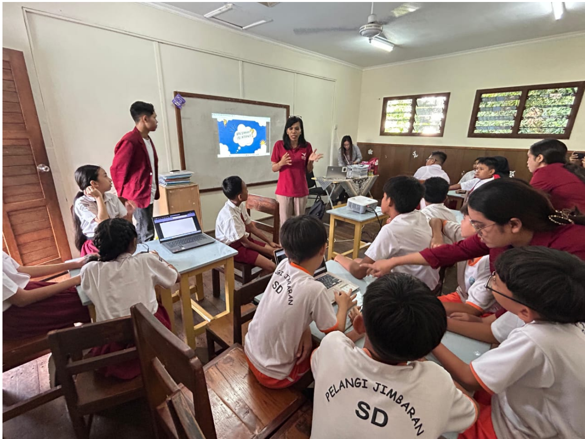
Gambar 1: Kegiatan Pembelajaran di SD Pelangi Jimbaran