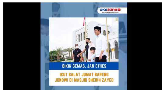
Gambar 6. Contoh slide shows

Media online Okezone menggunakan presentasi slide untuk jurnalisisme. Teks, foto, dan tayangan slide membentuk cerita video. Informasi ini menggambarkan peristiwa yang ada di dalam gambar dengan kata-kata. Seperti yang ditunjukkan dalam "Bikin Gemas, Jan Ethes Ikut Jokowi Salat Jumat di Masjid Syekh Zayed", Presiden Jokowi dan Ibu Iriana berjalan bersama. Presiden Jokowi menggendong cucunya, Jan Ethes. Dalam keterangan foto tersebut dijelaskan bahwa Presiden Jokowi sedang menggendong cucunya, Jan Ethes. Anak kecil dalam foto tersebut mungkin tidak akan dikenal tanpa adanya tulisan tersebut.