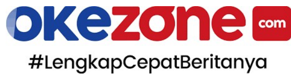
Gambar 2. Logo Okezone.com

Media daring sangat penting dalam teori media baru dalam studi media dan komunikasi massa. Akses yang fleksibel terhadap materi di beberapa platform digital, balasan interaktif dari pengguna, keterlibatan kreatif, dan pengembangan komunitas di sekitar konten media adalah bagian dari frasa tersebut (Khumaedi, 2020). Gagasan ini juga mencakup penciptaan waktu nyata, yang menggambarkan informasi yang berubah dengan cepat agar sesuai dengan situasi saat ini. Berdasarkan argumen di atas, penulis ingin menyelidiki mengapa multimedia sangat penting bagi jurnalisisme Okezone.com.