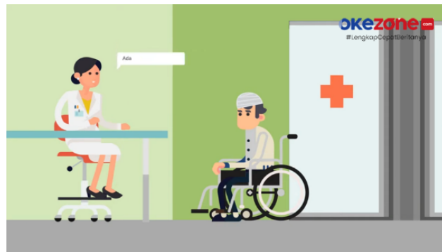
Gambar 3. Contoh Penggunaan Animasi

Fitur-fitur ini digunakan untuk menjelaskan dengan jelas dan mudah bagaimana program Jasa Raharja membantu pelanggan mereka dan meningkatkan minat masyarakat, terutama di antara mereka yang tidak terbiasa dengan program ini. Animasi digunakan untuk meningkatkan alur narasi dengan menampilkan gambar yang jelas sehingga penonton dapat memahaminya. Narasi atau penjelasan audio digunakan untuk membantu pemirsa memahami animasi. Grafik juga digunakan untuk mengilustrasikan kejadian seperti bunuh diri, pembunuhan, penganiayaan, dan reka ulang yang tidak dapat dilihat. Kejadian-kejadian ini mencegah media untuk menampilkan foto tanpa filter. Menurut Pasal 4 Kode Etik Jurnalistik Persatuan Wartawan Indonesia tahun 2006, wartawan tidak boleh menyebarkan berita bohong, fitnah, sadis, dan cabul (Biu, Wutun & Nafie, 2022)