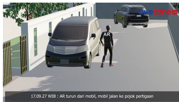
Gambar 4. Contoh Penggunaan Ilustrasi.

Fitur-fitur ini digunakan untuk menjelaskan dengan jelas dan mudah bagaimana program Jasa Raharja membantu pelanggan mereka dan meningkatkan minat masyarakat, terutama di antara mereka yang tidak terbiasa dengan program ini. Animasi digunakan untuk meningkatkan alur narasi dengan menampilkan gambar yang jelas sehingga penonton dapat memahaminya. Narasi atau penjelasan audio digunakan untuk membantu pemirsa memahami animasi. Grafik juga digunakan untuk mengilustrasikan kejadian seperti bunuh diri, pembunuhan, penganiayaan, dan reka ulang yang tidak dapat dilihat. Kejadian-kejadian ini mencegah media untuk menampilkan foto tanpa filter. Menurut Pasal 4 Kode Etik Jurnalistik Persatuan Wartawan Indonesia tahun 2006, wartawan tidak boleh menyebarkan berita bohong, fitnah, sadis, dan cabul (Biu, Wutun & Nafie, 2022)