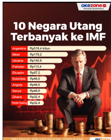
Gambar 5. Contoh Infografis

yang menarik untuk membantu audiens lebih cepat memahami. Infografis, seperti halnya berbicara di depan umum, mencerahkan, menghibur, dan mendorong audiens untuk memperhatikan, membaca, membuat kesimpulan, dan bertindak berdasarkan informasi tersebut.